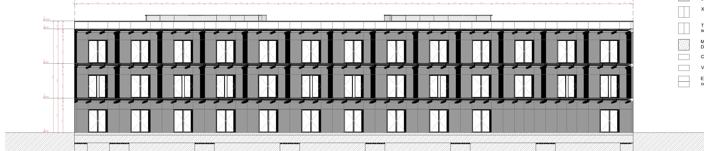
Alçat nord, pell interior